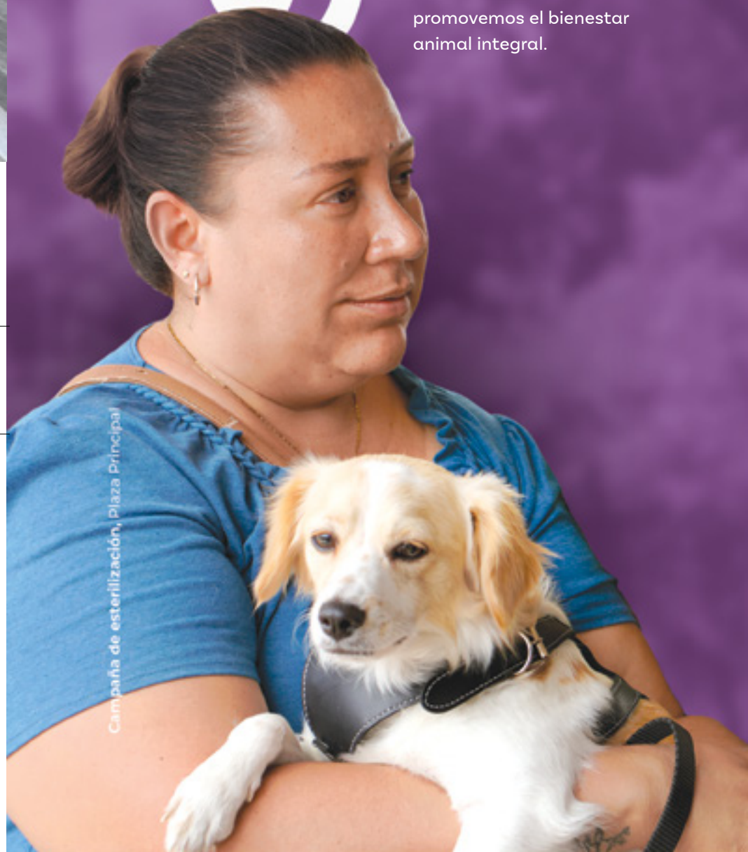
Campaña de esterilización, Plaza Principal

Mapeamos el 100% de las rutas del municipio, mejorando la cartografía y obteniendo datos precisos sobre el transporte público. Por primera vez, contamos con mapas de rutas, trayectos, horarios, frecuencias y tarifas, brindando certeza a los usuarios.