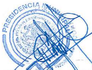
CARLOS ALBERTO SOTO DELGADO PRESIDENTE MUNICIPAL

En ese sentido, se da cumplimiento al Postulado Básico de la Contabilidad Gubernamental de Valuación, que señala "Todos los eventos que afecten económicamente al ente público deben ser cuantificados en términos monetarios y se registraran al costo histórico o al valor económico más objetivo, registrándose en moneda nacional".